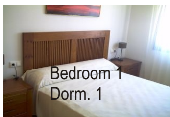
Bedroom 1 Dorm. 1