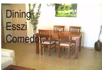
Dining Esszi Comedor