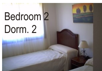
Bedroom 2 Dorm. 2